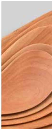
2013 Artesanía Tehuelche Tallados en Madera Nativa