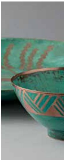
2013 Taller Sur