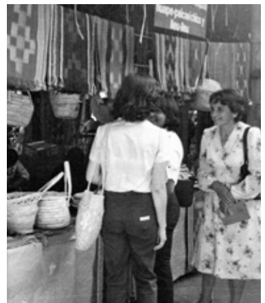
Antiguas imágenes de los primeros años de la Muestra de Artesanía UC en el Parque Bustamante.