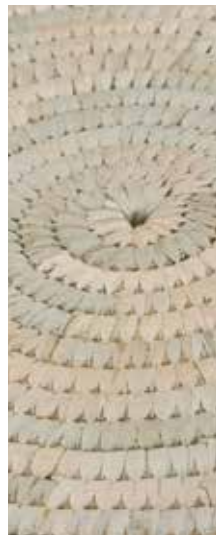
2013 Agrupación Ñocha Malen