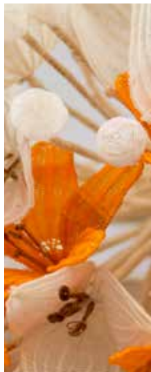
2012 Crin Fusión