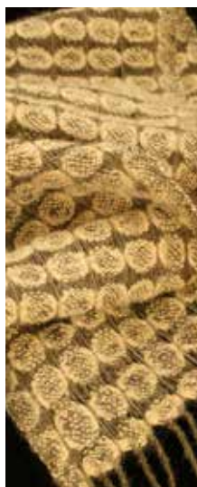
2009 Asociación Indígena de Mujeres Artesanas