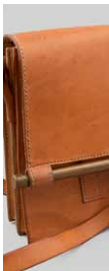
2012 Marroquinería Vicencio Ulloa