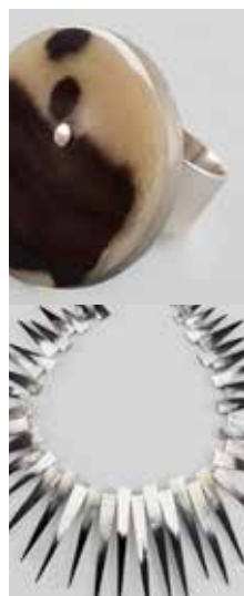
2008 Walka Studio